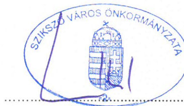
Sváb Antal Béla