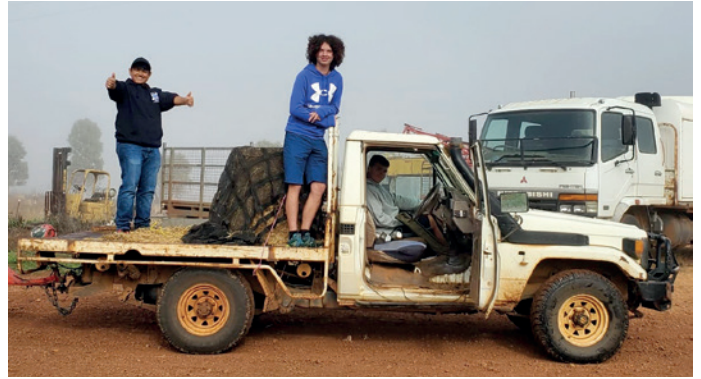
Élet a Dunedoo-i farmon

Aztán innen már Sydney-be indultunk vissza, kelet felé, de még előtte megálltunk a Kék-Hegység Nemzeti Parknál. Híres hely, szép panoráma, hatalmas tatóngó mélységekkel. Sydney-be visszaérve egy kollégiumban szálltunk