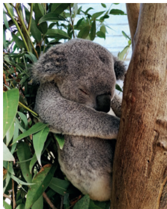
Alvó koala testközelből

Egy szikszo fiatalembernek megadatott az a lehetőség, hogy eljusson Ausztráliába. Az alábbiakban az ő beszámolóját olvashatjuk.