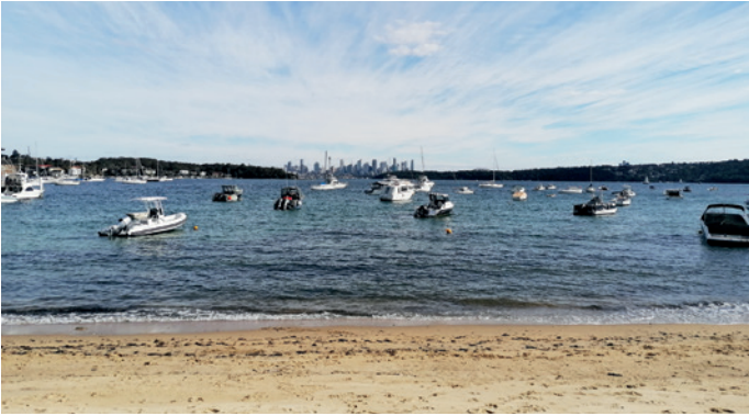
Sydney a Watsons Bay városnegyed felől

ni az egyes ausztrál kifejezéseket, hogy megértsük egymást. A tábor érdekessége az volt, hogy nem egy helyen tartózkodtunk. Két hét alatt egy nagy kört tettünk meg, először észak felé haladva. Érintettünk több kisebb-nagyobb várost, viszont három állomást szeretnék kiemelni.