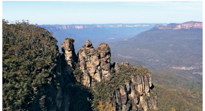
A három nővér sziklahármas (Kék-hegység)

meg. A várost most már nyolcan fedezhettük fel, és nagy segítség volt az, hogy előzőleg már hárman bejártuk a várost. Napközben és esténként is sokat szórakoztunk, így sok alváásra nem jutott időnk. Sydney különlegessége az, hogy a város megőrizte számos zöldterületét, így a belvárosban erdős területtel is találkozhattunk a felhőkarcolók között, amellett, hogy a város az óceán mellett fekszik, és a városban is elterjedt a komp, mint tömegközlekedési eszköz.