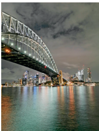
A Sydney-i Kikötő híd

Ausztrália hatalmas ország, kicsivel több, mint 83-szor nagyobb, mint Magyarország és 1,3-szor akkora, mint a kontinentális Európa. Az utolsó, nyolcórás repülésből öt óra volt, míg átrepültük az országot. Amint feljött a nap,