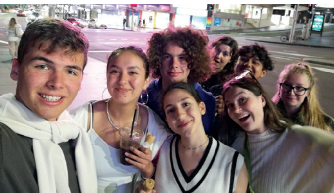
A tábor résztvevői (nyolc diák, hét nemzet képviselője)